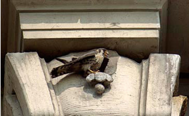
Buntfalke vor dem Nesteingang.

Wie erkennt man den Buntfalken? In New York Stadt sitzen diese kleinen Falken Gern auf Antennen auf Mehrfamilienhäusern und anderen hohen Plätzen, wie Wassertürmen. Von solchen Ausguckplätzen können sie Jagdflüge starten. Sie haben ihre bevorzugten Sitzplätze. Wenn Sie einen auf einem Bauwerk sehen, erwarten Sie, ihn dort wiederzufinden.