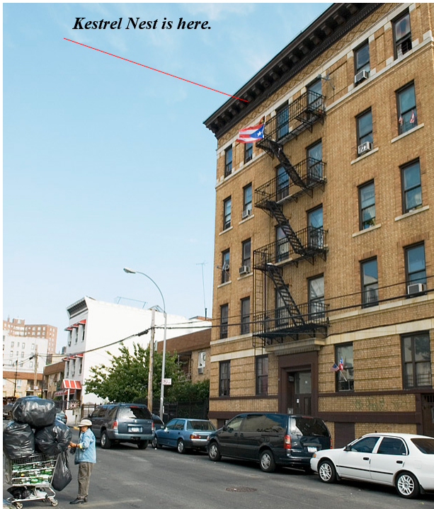
Falkennistplatz in der Südbronx

Typische Nistplätze sind Öffnungen nahe dem Giebel, oft genau unter dem Dach (wie in einer Deckenleiste). Buntfalken nisten an den Stadtstrassen und gewöhnlich fühlen sie sich durch Menschen nicht gestört, so lang sie ihre Brut in Ruhe lassen. Schauen Sie sich den Nestplatz an der Dachkante an!