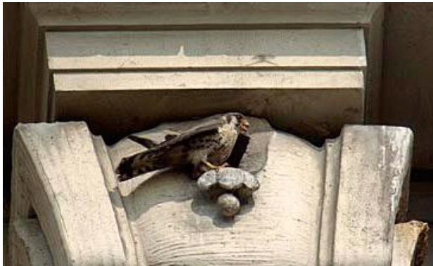
Боривітер перед входом у гніздо, Мангатан

Як знайти боривітра? У Нью Йорку ці малі соколи сідають на телевізійних антенах розміщених на дахах високих житлових будинків та інших високих структур, де вони слідкують за добычею. В них є улюблені місця, до яких постійно повертаються.