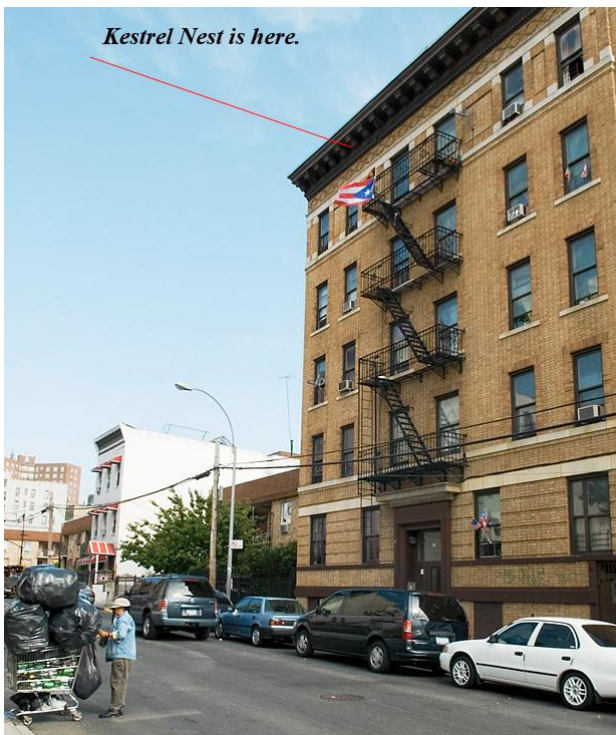
Гніздо боривітра у південному Бронксі

Типове гніздо боривітра американського має вхід часто зразу під дахом дому. Сокіл може гніздитися близько людей, якщо вони не намагаються непокоїти його. Подивіться світлини з гніздом внизу та на право.