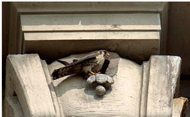
Pustulka siedząca przy wejściu do gniazda, Manhattan

Jak znaleźć pustulkę? W Nowym Yorku te małe sokoły przesiadują na antenach telewizyjnych znajdujących się na dachach apartamentowców i innych wysokich budynków, czatując na zdobycz. Mają swoje ulubione miejsca. Powracają do nich przez cały czas.