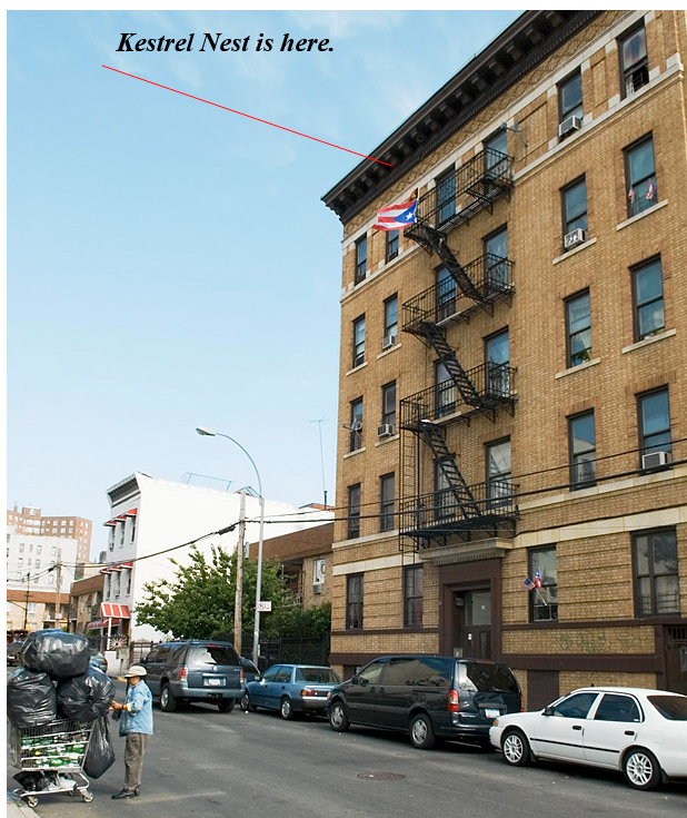
Gniazdo pustulek we wschodnim Bronxie

Typowe gniazdo to nisza z otworem blisko dachu budynku, często tuż pod nim. Pustulki gniazdują w sąsiedztwie człowieka i nie niepokojone tolerują jego bliskość. Tak jak te na zdjęciach poniżej i na prawo.